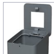
Anello per collocamento sacchi.

- Anello interno in acciaio inox per collocare i sacchi per rifiuti. Rif. AIP385X385