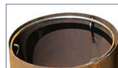
Anello per collocamento sacchi

ADO, si riserva il diritto di modificare le specifiche dei prodotti senza preavviso.