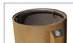
Anello per collocamento sacchi.