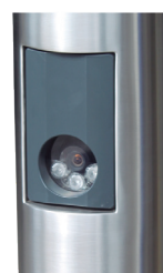
Dettaglio lettore targhe.