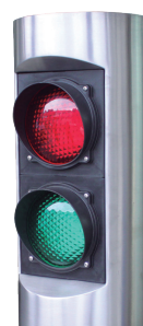
Dettaglio semaforo a led.

Acciaio inox ..... Ref. PCACCES04 Acciaio laccato ..... Ref. PCACCES03